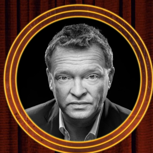
MAX BIALYSTOCK | SERGE POSTIGO

Max est un producteur en faillite égoïste et arrogant. De nature fougueuse et sarcastique, il peut être très intimidant. Prêt à tout pour gagner de l'argent, jusqu'à flouer chaque petite vieille dame de New York, il se lance dans la production du pire show du monde, visant à escroquer les investisseurs en portant à la scène un flop assuré.